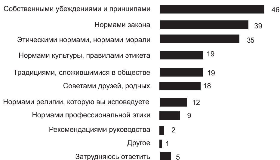
Рис. 3. Чем руководствуются россияне в трудной ситуации

Радикальные экономические перемены последних десятилетий существенно ускорили процессы социальной трансформации. Стало заметно развитие индивидуальных предпочтений, стремление к рационализации жизни. Подтверждением этого являются результаты следующего социологического исследования (см. рис. 3).