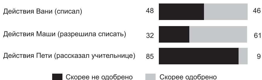
Рис. 2. Нравственная диспозиция в отношении списывания

Для того чтобы полнее оценить этот проект, возможность альтернативных подходов, важно представить соответствующую этическую диспозицию в нашем обществе. О ней свидетельствуют результаты социологического исследования, проведенного под руководством автора в 2015 году (см. рис. 2) 1 .